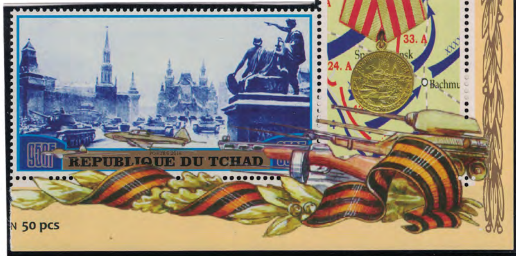
Пожарные – Герои СССР